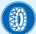
「チェーン規制」の区間であることを表す標識